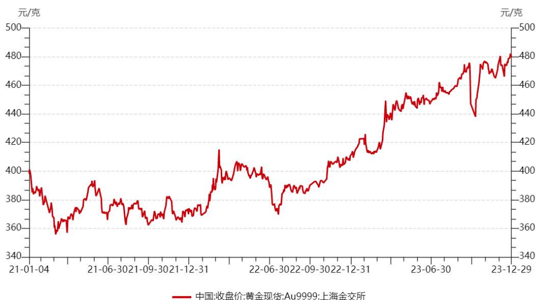
图：2021 年初至 2023 年末黄金价格趋势图

截至 2023 年年底,伦敦金(LBMA)午盘价达到 2,078.4 美元/盎司,创下年末收盘价新高,将黄金投资年回报率推至 15%。2023 年平均金价为 1,940.54 美元/盎司,同样创下历史新高,相比 2022 年上涨了 8%。2023 年,国际黄金价格在高位波动。12 月底,伦敦现货黄金年终价格为 2062.40 美元/盎司,较 2023 年初开盘价 1835.05 美元/盎司上涨 12.39%,年度均价 1940.54 美元/盎司,较上一年 1800.09 美元/盎司上涨 7.80%。上海黄金交易所 Au9999 黄金 12 月底收盘价 479.59 元/克,较 2023 年初开盘价上涨 16.69%,全年加权平均价格为 449.05 元/克,较上一年上涨 14.97%。